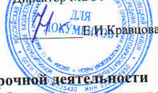
Таблица-сетка часов внеурочной деятельности муниципального бюджетного общеобразовательного учреждения средней общеобразовательной школы № 11 им. А.В. Кривоноса с. Свободного муниципального образования Брюховецкий район для 1-го класса, реализующих федеральный государственный образовательный стандарт начального общего образования на 2020 – 2021 учебный год

УТВЕРЖДЕНО решением педагогического совета от 31.08.2020 года, протокол №1. Директор МБОУ СОШ №11 им. А.В. Кривоноса