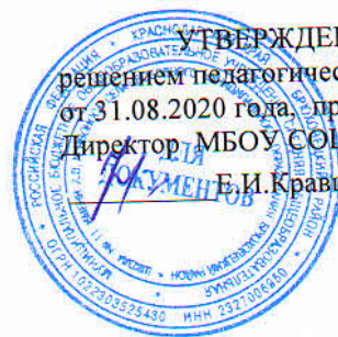
Таблица-сетка часов внеурочной деятельности муниципального бюджетного общеобразовательного учреждения средней общеобразовательной школы № 11 им. А.В. Кривоноса с. Свободное муниципального образования Брюховецкий район для 3-го класса, реализующего федеральный государственный образовательный стандарт начального общего образования на 2020– 2021 учебный год