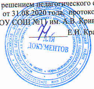
Таблица-сетка часов внеурочной деятельности Муниципального бюджетного общеобразовательного учреждения средней общеобразовательной школы № 11 имени А.В. Кривоноса с. Свободное муниципального образования Брюховецкий район для 11-го класса, реализующего федеральный государственный образовательный стандарт основного общего образования на 2020 – 2021 учебный год