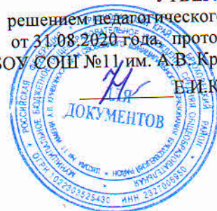
Таблица-сетка часов внеурочной деятельности Муниципального бюджетного общеобразовательного учреждения средней общеобразовательной школы № 11 имени А.В. Кривоноса с. Свободное муниципального образования Брюховецкий район для 7-го класса, реализующего федеральный государственный образовательный стандарт основного общего образования на 2020 – 2021 учебный год