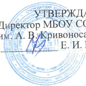
График питания учащихся на 2024-2025 учебный год